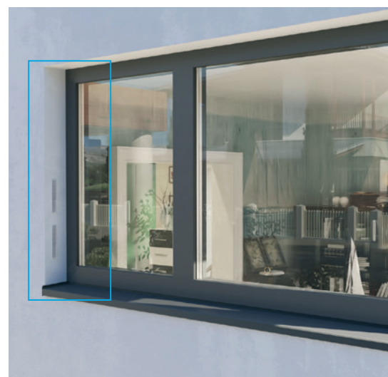
montáž pod omítku systému

Komponenty pro GEALAN-CAIRE® smart jsou k dispozici v různých barvách a povřích a dokonale se přizpůsobí vašemu okennímu systému uvnitř i venku. Větrací systém může být instalován pod hráz i pod omítku. Základní část nasazovacího kanálu, kterou lze rozšířit pomocí adaptéru o mřížce 20 mm, umožňuje bezproblémovou instalaci do vašeho tepelně izolačního kompozitního systému bez ohledu na to, jak silná je izolační vrstva. Viditelné zůstávají pouze úzké mřížky vstupu a výstupu vzduchu v podhledu okna.