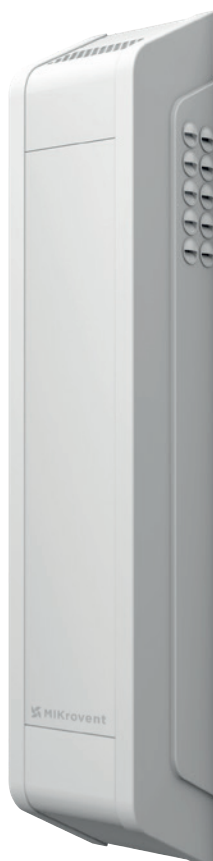
GEALAN-CAIRE® MIKrovent 60 / 120

GEALAN-CAIRE® MIKrovent 120: Průchod vzduchu od 60 do 120 m 3 za hodinu. Pro velké místnosti (např. školky, školy). Kromě teploty a vlhkosti senzory také volitelně měří obsah CO 2 a VOC.