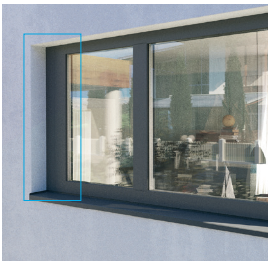
GEALAN-CAIRE® smart namontovaný viditelně na rámu

GEALAN-CAIRE® smart je aktivní decentralizovaný větrací systém s efektivní rekuperací tepla pro stávající i nové budovy, který splňuje nejvyšší nároky na ventilaci a energetickou účinnost. Přesná senzorová technologie měří teplotu a vlhkost vzduchu a zcela automaticky, nebo individuálně řídí přívod čerstvého vzduchu. Filtry zachycují prach, pyl a jiné škodlivé částice. GEALAN-CAIRE® smart můžete pohodlně ovládat pomocí mobilní aplikace ve vašem chytrém telefonu nebo tabletu a snadno jej integrovat do vašeho inteligentního domácího systému. Aplikace jsou k dispozici pro operační systémy Android i iOS.